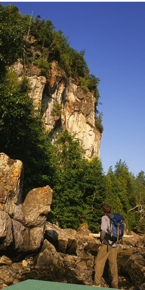
Anse aux Bouleaux Est